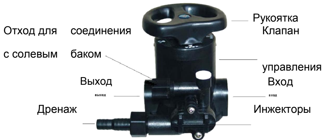
Таблица № 1.